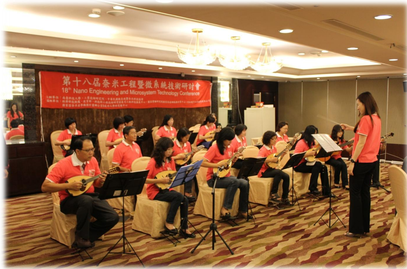
NMC 2014晚宴 曼陀林表演