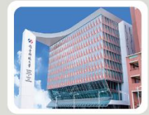
▲ 南臺科技大學大門照